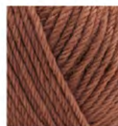
581 Pembe Çikolata Ruby Chocolate Розовый Шоколад