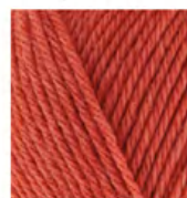
691 Küllü Turuncu Dusty Orange Пыльный Апельсин