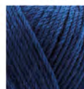
846 Açık Lacivert Light Navy Светло Синий