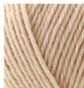
152 Açık Bej Melanj Light Beige Melange бежевый меланж