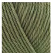
274 Enginar Artichoke Артишок