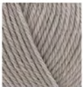
21 Gri Grey Серый