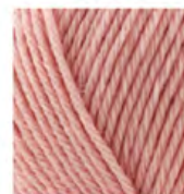
161 Pudra Powder пудра