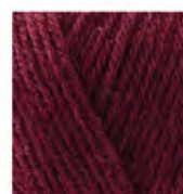
578 Koyu Bordo Dark Burgundy Темно Бордовый