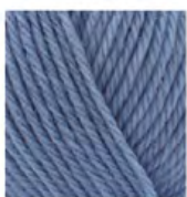
432 Çelik Mavisi Steel Blue Стальной