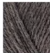
182 Orta Gri Melanj Medium Grey Melange Средне-Серый Меланж