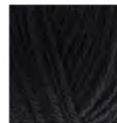
60 Siyah Black черный