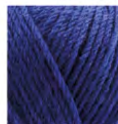
797 Gece Mavisi Midnight Blue Синяя Ночь