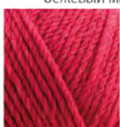
740 Ahududu Raspberry Малина