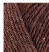
240 Kakao Cocoa Какао