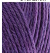
235 Çarkıfelek Passion Flower Цветок Страсти