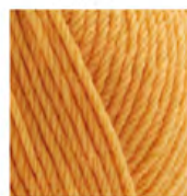
423 Toskana Sarısı Tuscany Yellow Тосканский Желтый