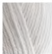
55 Beyaz White белый