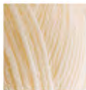
01 Krem Cream кремовый